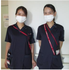
日勤帯：紺色スクラブ

2パターン導入の主な狙いとしては、看護師の時間外労働の削減、軽くて活動しやすいスクラブにすることで、業務量の多い日勤帯の身体的負担軽減など、業務改善を踏まえた導入となっています。日勤帯の外来や病棟では紺スクラブの看護師にお声かけをお願いします！